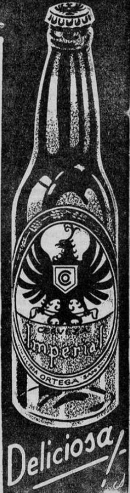
DEPORTES DE ALAJUELA

CARACAS, Venezuela, 21.—Ante 10 mil personas el equipo de fútbol "Millonarios" venció a "La Salle", con score de cuatro goles por cero, en un encuentro que tuvo lugar anoche en Caracas. El primer tiempo terminó uno por cero a favor de los "Millonarios".